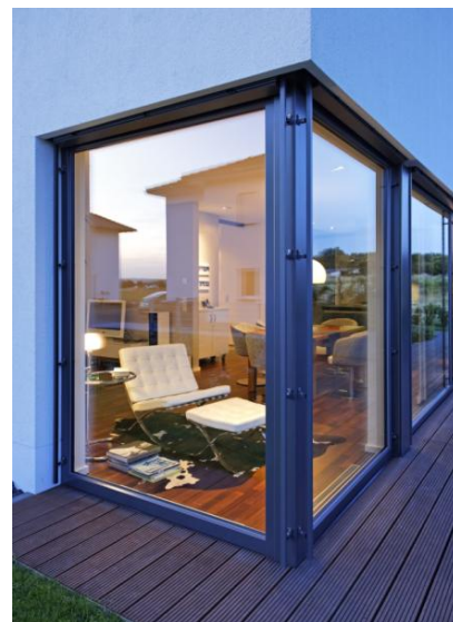
Több fény és hely a teljes komfortért

Az innovatív, három különböző síkon elhelyezkedő tömítés garantálja a maximális szél- és csapóeső elleni védelmet, valamint az optimális hanggátlást. Ezenkívül a minőségi zár- és vasalatrendszer a betörésgátlás tekintetében is eleget tesz a magas szintű elvárásoknak (WK 2-es osztályig).