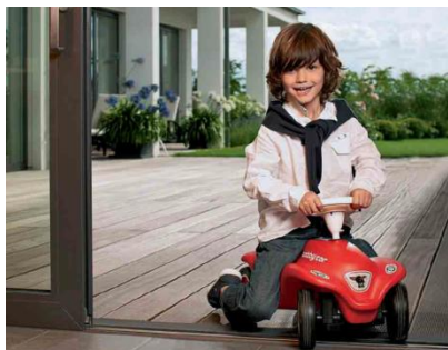
Szabad átjárás a teraszra

Emelő-toló ajtók alkalmazásával olyan tereket hozhatunk létre, melyeket átjár a fény, szép kilátást nyújtanak, és az épület hangsúlyos részévé válnak. Helytakarékos kialakításuk lehetővé teszi nagyvonalú terek megvalósítását, és növeli a lakókomfortot. Ki ne szeretné, hogy a lakótér határait csupán néhány gyors mozdulattal ki tudja bővíteni? Az emelő-toló ajtók új, szabad tereket nyitnak meg: a télikert eggyé válik a kerttel – az erkély és a terasz pedig a lakótér részévé válik.