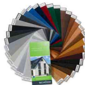
Színes és faerezetű fóliák széles skálájából választhat